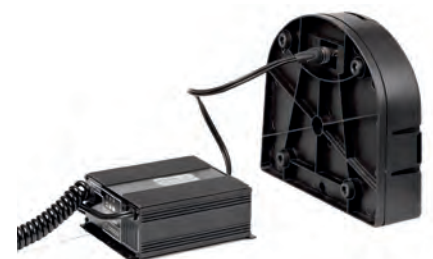
Chargeur et batterie amovible inclus