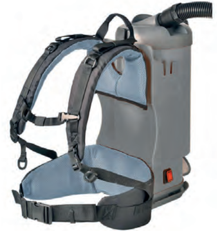
Harnais renforcé pour un maintien confortable de l'aspirateur