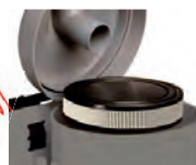
Filtre absolu HEPA H13