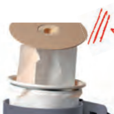
Filtre polyester et sac microfibre