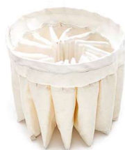
Filtre à poches antistatique M 1 \mu