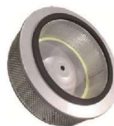
Cartouche de filtration absolue HEPA H14