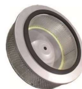
Cartouche de filtration absolue HEPA H14