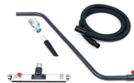
Kit accessoires inclus