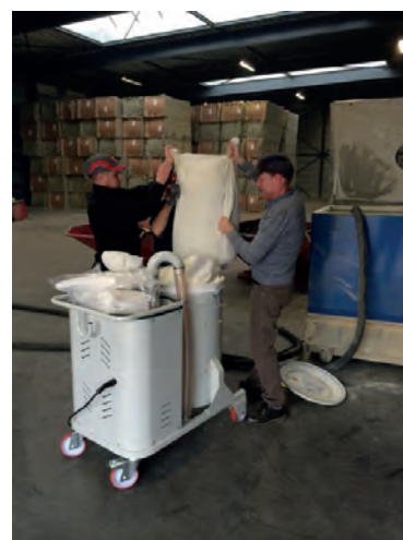
Vidange de l'aspirateur verticale