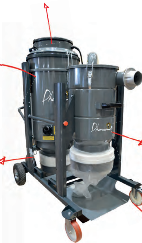
Construction industrielle en acier peint epoxy