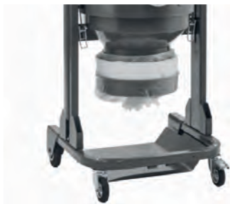
Système d'ensachage longopac