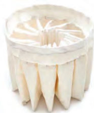
Filtre à poches Grande surface filtrante