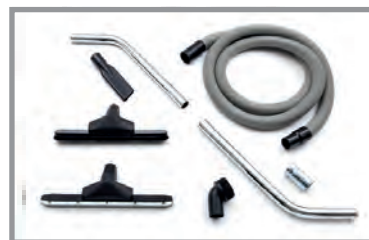
Kit accessoires intégré