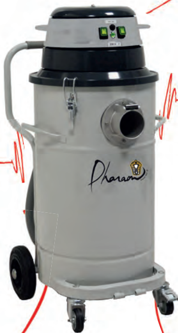
Structure en acier peint époxy le 802WD existe en option cuve INOX