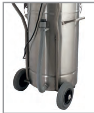
Flexible de vidange liquides