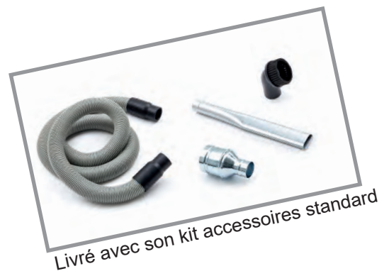
Livré avec son kit accessoires standard