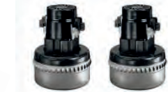
2 moteurs by-pass monophasé