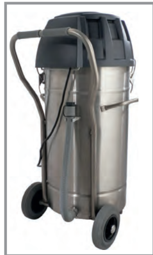
Flexible de vidange liquides