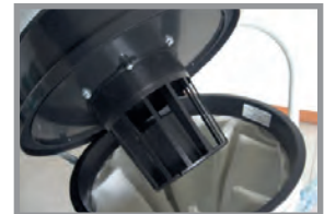
Flotteur pour liquide