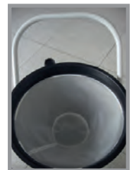
Filtere polyester + surfiltere en nylon (uniquement pour le modèle 802WD)