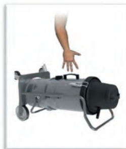
Poignée à la verticale pour un transport facile