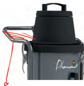
Poignée de poussée