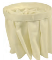
Filtration à poches Grande surface filtrante