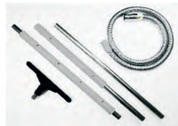
Kit four TA.1048.0000