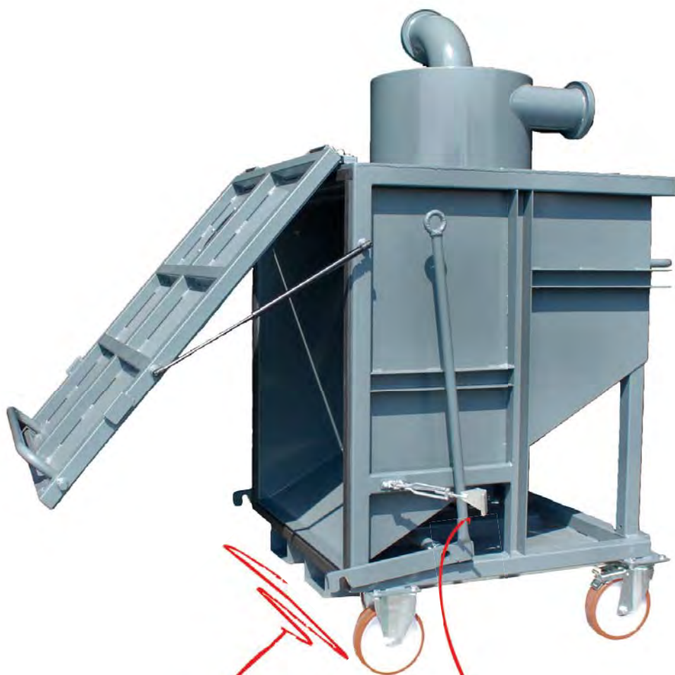
Levier d'ouverture de la porte